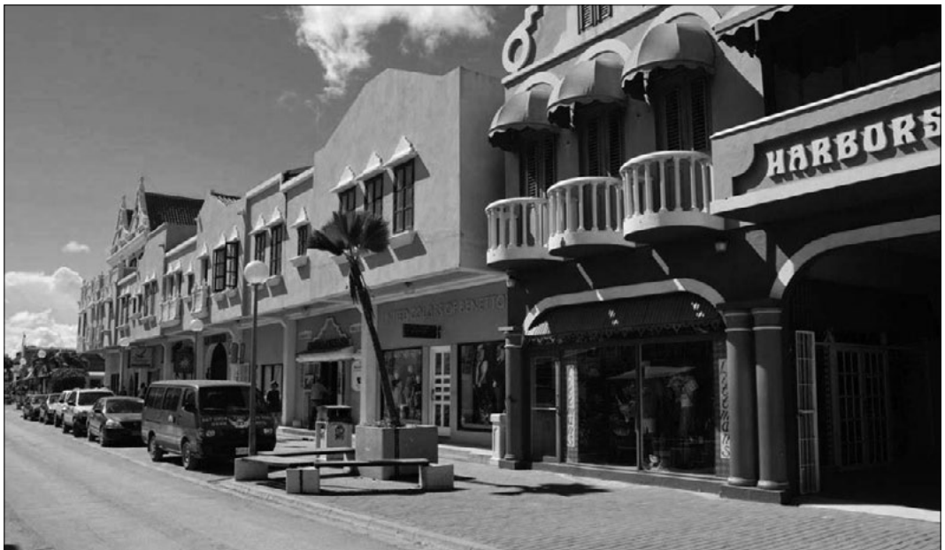
Een straat in Kralendijk, de hoofdstad van Bonaire